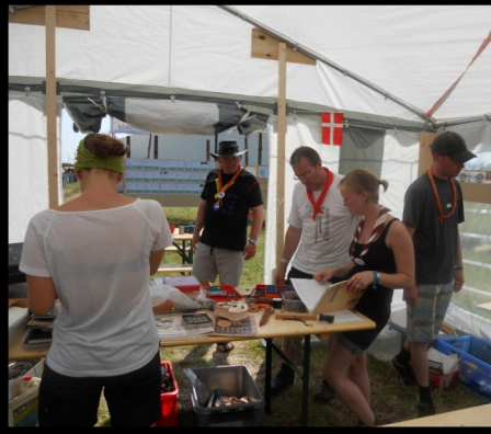
Der arbejdes med læder