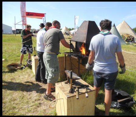
Så er der tændt op i smedjen