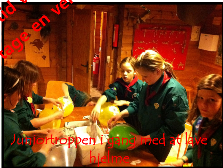
Juniortroppen i gang med at lave hjelme

Du er altid velkommen til at tage en ven med!