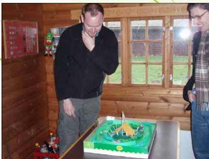
Juniortroplederen overvejer næste træk på klanens mikrogolfbane

Uge 28 holder vi sommerlejr sammen med flokken