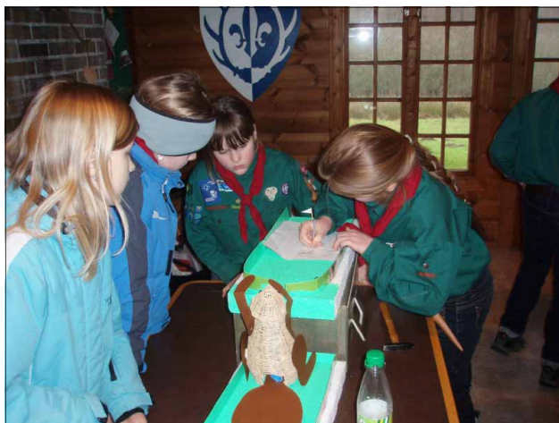
Der holdes styr på regnskabet under mikrogolfturneringen!!