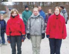
Vinderhold fra lederne/klanen: "Pink ladies"

På turen deltog 2 spejderpatruljer, Ørne og Svaler, samt et lederhold og et klanhold udover de 4 post-mandskaber. Ialt 25 stk.