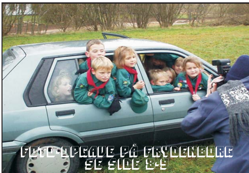
FOTO-OPGAVE PÅ FRYDENBORG SE SIDE 8-9