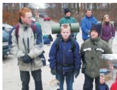
Vinderhold fra spejderne: Ørne

Dagen efter stod på fangst af mad med hjemmelavede redskaber og filtrering af vand indtil de kom til den flyver der skulle samle dem op. Desværre havde den tabt kompas-nålen så den måtte først findes vha. deres egne kompasser. Efter hjemkomsten blev prøven analyseret og turen var slut.